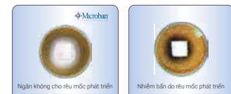
Thử nghiệm chỉ ra hiệu quả chống rêu mốc của công nghệ Microban

Chất bảo vệ Microban® được sử dụng trong quá trình sản xuất, không bị rửa trôi hoặc hao mòn. Chất bảo vệ Microban được ứng dụng nhằm tạo ra tính kháng khuẩn liên tục cho sản phẩm, thậm chí ở những khu vực khó hoặc không thể tiếp cận để làm sạch.